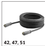
42, 47, 51